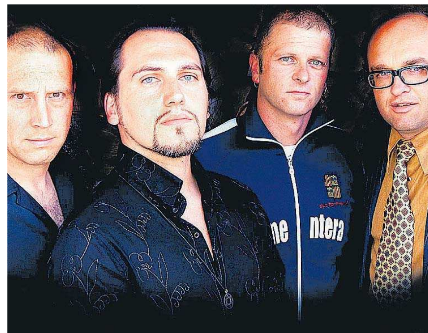
The Whole Chance.